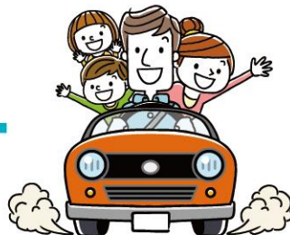
他金融機関等のローン (700万円まで)