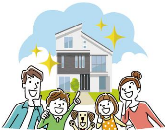
JA住宅ローン (新築・借換)