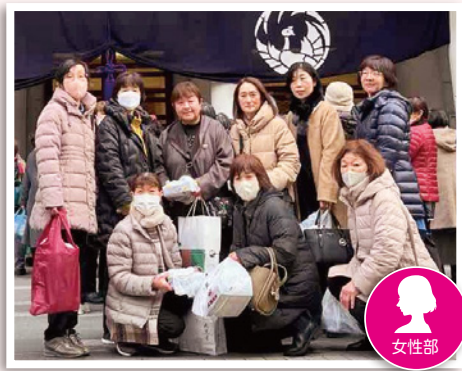
銀座にある歌舞伎座の前で

女性部御殿場地区本部は女性セミナーを行い、部員221人が参加しました。 今回は歌舞伎鑑賞を企画。映画のヒットもあり、多くの申し込みがありました。 同セミナーは、部員の学びの場・仲間づくりの場として毎年開催しています。