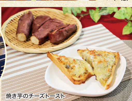
焼き芋のチーストースト