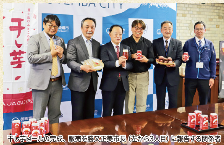
干し芋ビールの完成、販売を勝又正美市長（左から3人目）に報告する関係者

ねっとりとした食感と高い糖度が特長の紅はるかを使用した御殿場・小山さつまいも加工品生産組合の「干し芋」と「焼き芋」。御殿場地区の冬の特産品として人気が高く、全国から注文が届くなど、認知度も上がってきた両商品に今年、新しい風が吹きました。 干し芋は、1月10日の「ほしいもの日」に茨城県水戸市の水戸プラザホテルで開かれた「全国ほしいもグランプリ2026」で見事入賞。また、同生産組合が干し芋を作る際に出るサツマイモの皮や切れ端などを活用して、御殿場市保土沢の株式会社FUJI PREMIUM BREWINGが「干し芋ビール」を製造、1月15日から販売しています。 「干し芋ビール」は、廃棄されるはずの不要品や廃棄物に新たな価値を付け加し、価値の高い製品に生まれ変わらせるアップサイクル商品として注目されています。 焼き芋は、1月25日に放送された静