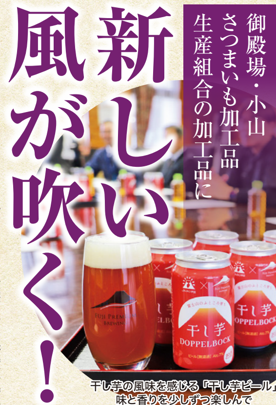
干し芋の風味を感じる「干し芋ビール」 味と香りを少しずつ楽しんで

ねっとりとした食感と高い糖度が特長の紅はるかを使用した御殿場・小山さつまいも加工品生産組合の「干し芋」と「焼き芋」。御殿場地区の冬の特産品として人気が高く、全国から注文が届くなど、認知度も上がってきた両商品に今年、新しい風が吹きました。 干し芋は、1月10日の「ほしいもの日」に茨城県水戸市の水戸プラザホテルで開かれた「全国ほしいもグランプリ2026」で見事入賞。また、同生産組合が干し芋を作る際に出るサツマイモの皮や切れ端などを活用して、御殿場市保土沢の株式会社FUJI PREMIUM BREWINGが「干し芋ビール」を製造、1月15日から販売しています。 「干し芋ビール」は、廃棄されるはずの不要品や廃棄物に新たな価値を付け加し、価値の高い製品に生まれ変わらせるアップサイクル商品として注目されています。 焼き芋は、1月25日に放送された静