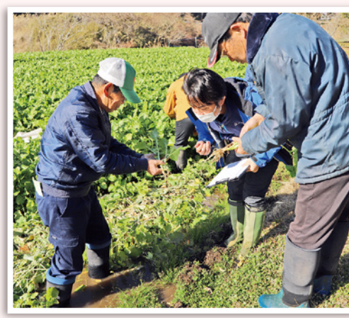
水かけ菜の生育状況を確認する生産組合の役員とJA職員(中央)

御殿場小山水かけ菜生産組合の「水かけ菜漬」の販売が、ファーマーズ御殿場で始まりました。店頭の商品が並び、次々に手に取る来店者が見られました。 出荷を前にした1月9日には、同生産組合の役員と御殿場地区販売課の職員が、管内の水かけ菜栽培ほ場7か所を巡回し、生育状況や根こぶ病の有無などを確認しました。今期は天候に恵まれ、参加者らは「例年より生育が早く、品質も良い」と話しました。 巡回後は御殿場地区本部で「第41回 統一出荷説明会」を実施。品質の維持向上に向けて漬け込みや袋詰め、出荷方法などについて再度確認しました。