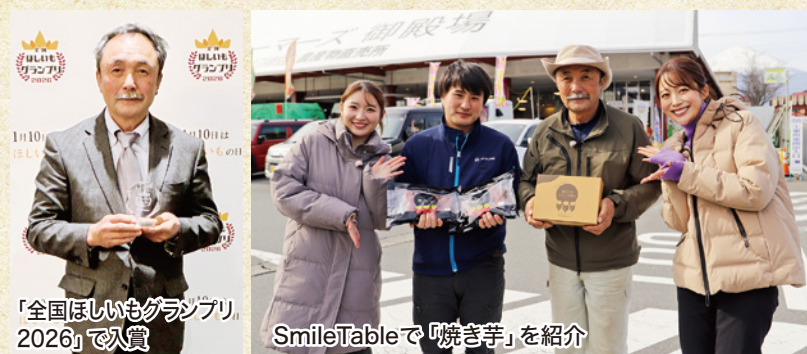
「全国ほしいもグランプリ 2026」で入賞