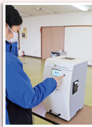
導入した米穀用穀粒判別器

御殿場営農経済センターは、JA共済の地域・農業活性化促進助成金を活用し、米穀用穀粒判別器を導入しました。 御殿場地区営農課は「最新式の穀粒判別器を導入することで、着色粒や胴割粒、砕粒などの割合の測定精度が上がり、玄米の品質安定化につながる」と話します。 同器は、令和8年度から御殿場地区の米穀検査場で組合員に利用していただきます。