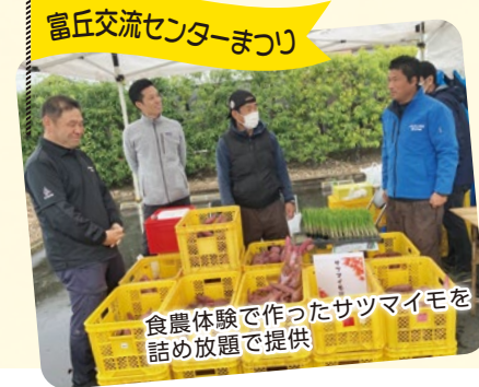
富丘交流センターまつり