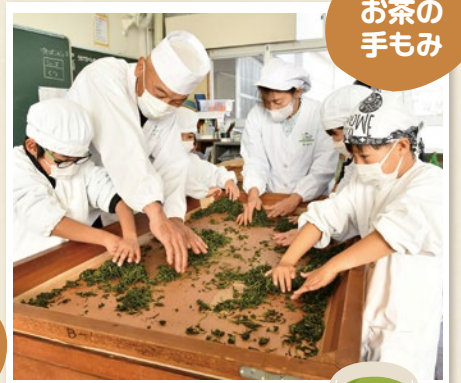
富士宮茶手揉保存会 & 富士根南小学校