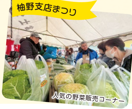
人気の野菜販売コーナー