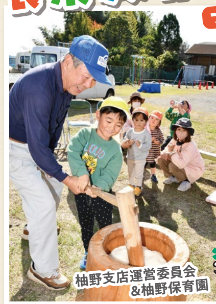
餅つき 柚野支店運営委員会 & 柚野保育園

営農経済センターや支店では地域の農家組合員の皆さまの協力も得て、11月～12月にかけてさまざまな食農教育活動を行いました。