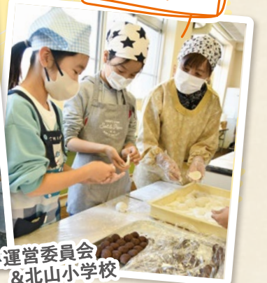
児童たちが 大福作りにも 挑戦！