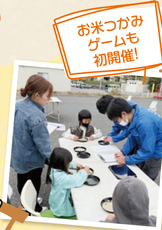
お米つかみ ゲームも 初開催！