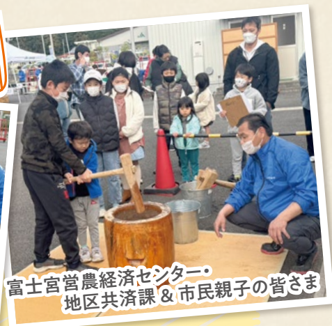
富士宮営農経済センター・ 地区共済課 & 市民親子の皆さま