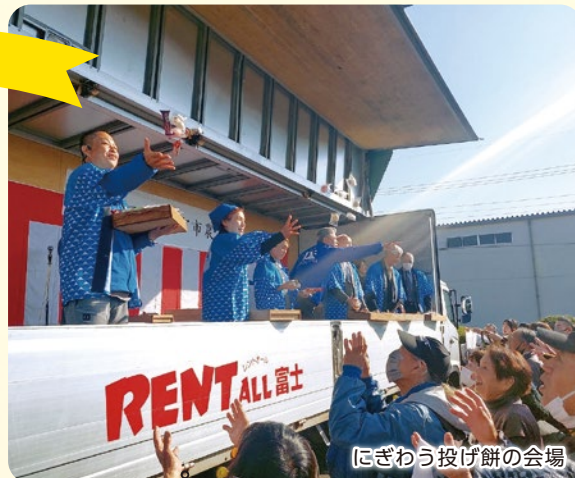
にぎわう投げ餅の会場