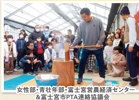
女性部・青壮年部・富士宮営農経済センター & 富士宮市PTA連絡協議会