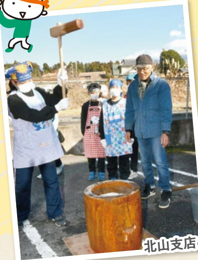
北山支店・運営委員会 & 北山小学校