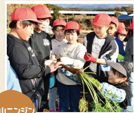
村山ニンジン 収穫