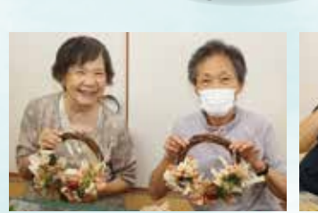
▲完成!かわいいリースができました♡