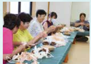
▲みんなでワイワイおしゃべりしながら、にぎやかムードでリース作り♪

富士北支部は文化祭に向けて、木材を削った際に出る“カンナ屑”を使ったリース作りに初めて挑戦しました。仲間同士で楽しみながら、それぞれの個性が光るすてきなリースが完成しました。