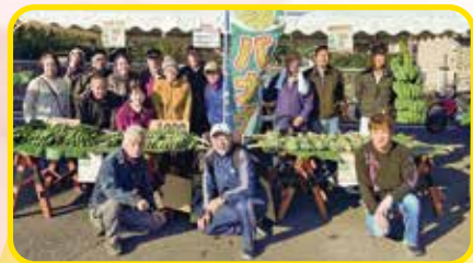
▲「富士露地ベルバナナの会」の皆さま