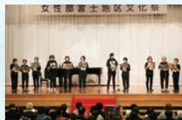
▲会場が1つになって合唱