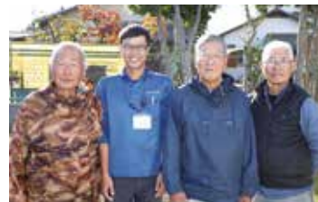
▲講師を務めた富士地区農業アカデミー部会の皆さまと営農アドバイザー