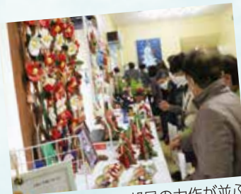
▲ロビー展示には部員の力作が並び

女性部富士地区本部は12月3日、文化祭を開催しました。各支部が舞台発表や作品展示で日々の活動の成果を披露。参加した部員はスコップ三味線やダンス、朗読劇や合唱など多彩な発表を楽しみ、交流を深めました。