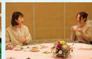
▲体験後は、ハーブティを楽しみながら座談会を開催