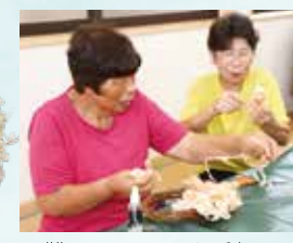
▲難しい...ちょっと手伝って!