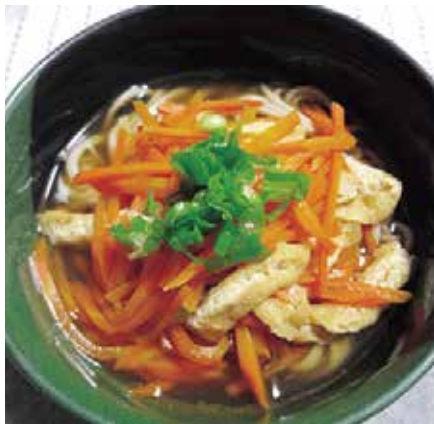
人参農家に代々受け継がれる「人参そば」