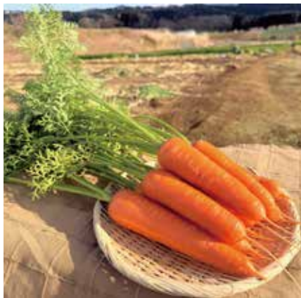
カロテンが豊富で糖度の高さが特長