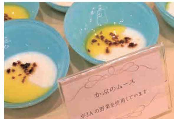
ふじ伊豆産の農産物を使用した料理が並ぶ

青壮年部は11月、出会いの場を提供する「農業青年との婚活パーティーin三島」を、みしまプラザホテルで初めて開きました。 独身農業者の増加や農家の担い手不足は、農業経営の存続にも関わる大きな問題です。そこで、青壮年部本部役員は地区からの要望を受け、同問題解決に向けて婚活事業実行委員会を立ち上げ、同会を開催しました。 当日は、管内各地区から青壮年部員27人と女性29人が参加。簡単なゲームで交流を図り、グループトークや食事