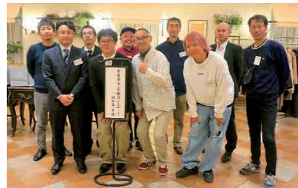
企画・運営を行った婚活事業実行委員会のメンバー

を交えながら会話を楽しみました。料理の食材には、ふじ伊豆の特産品や旬の地場農産物を提供。女性参加者には青壮年部員が生産するイチゴジャムやミカンジャムの記念品が贈られるなど、地域農業や地場農産物のPRも行いました。 今回は、56人の参加者の中から8組のカップルが成立。女性参加者からは「料理もおいしく、楽しい時間が過ごせた」との声がありました。今回の運営を振り返り、今後の活動のさらなる充実を図っていきます。