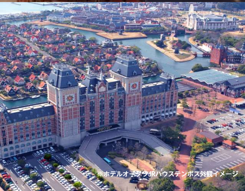
※ホテルオークラJRハウステンボス外観イメージ