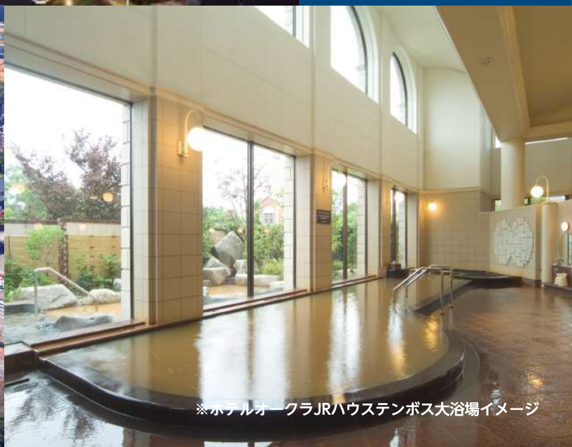
※ホテルオークラJRハウステンボス大浴場イメージ