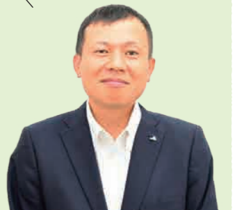
営農販売部 営農企画課