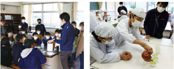
南小 職員から説明を受ける児童

あいら伊豆地区営農販売課は、12月6日と1月20日、あしたか山麓営農経済センターと合同で静岡茶講座を開き、多賀小学校(5・6年生120人)・南小学校(6年生113人)の児童が参加しました。講座では、お茶の歴史やお茶の入れ方を学んだ後、急須にお茶を入れて実践しました。児童は何度もお茶を入れて「2回目が一番おいしかった」「色がきれいだね」と楽しみました。