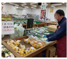
特設コーナーに農産物を並べるスタッフ

いで湯っこ市場は1月10日、「いとうの日」にちなんだイベントを開催しました。「いとう110」にちなみ、多くの生産者が協力して農産物と加工品の110円コーナーを設置。植木の特売品コーナーも開設したほか、1100円以上の購入者に「冷凍ミカン」や「エス」などを110個用意し、プレゼントしました。当日は、多くの来店客でにぎわい、プレゼントは開店後2時間ほどで終了しました。