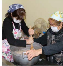
女性部員から指導を受ける受講生(左)

女子大学(通称「ハビ・カレ」)は1月23日、3号原調理施設で第2回講座「コンニャク作り体験」を開きました。受講生は、こんにゃくの起源や歴史などの説明を受けた後、講師の女性部員の指導を受けながら、初めてのコンニャク作りに挑戦しました。受講生は「自分たちで作ったコンニャクはとてもおいしかった。家庭でもまた作りたい」と話しました。