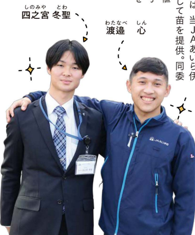
しのみや 四之宮 どわ 冬聖 わたなべ 渡邊 しん 心