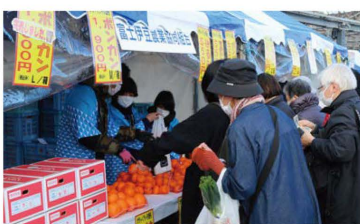
多くの来店客でにぎわうJAブース