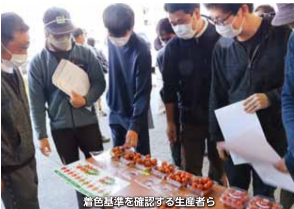
着色基準を確認する生産者ら

伊豆の国果菜委員会は4月5日、暖候期の目ぞろえ会を葦山野菜集出荷場で開催しました。着色が早まる暖候期の品質維持のため、生産者や市場関係者、JA職員がカラーチャートと見本のミニトマトを照らし合わせ、規格統一の徹底を図りました。