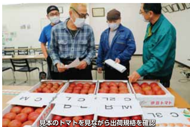
見本のトマトを見ながら出荷規格を確認