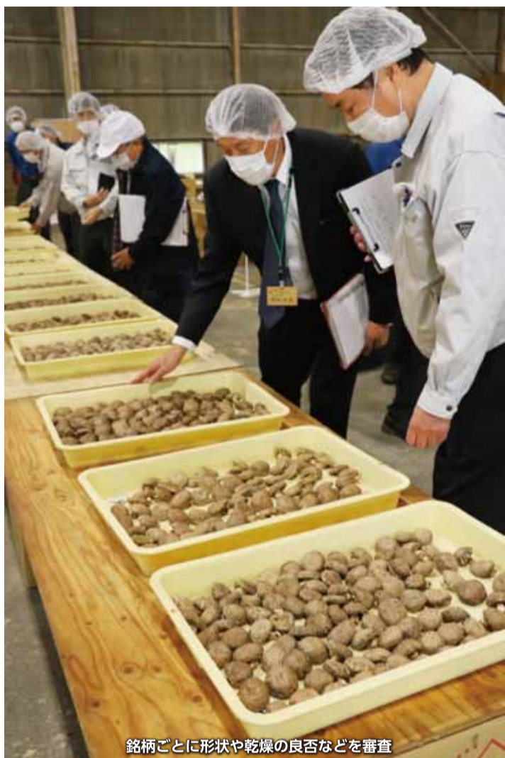
銘柄ごとに形状や乾燥の良否などを審査