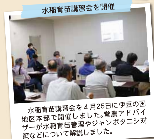
水稲育苗講習会を4月25日に伊豆の国地区本部で開催しました。営農アドバイザーが水稲育苗管理やジャンボタニシ対策などについて解説しました。