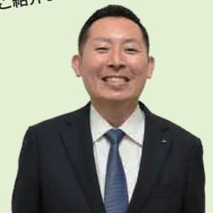
営農販売部 営農課