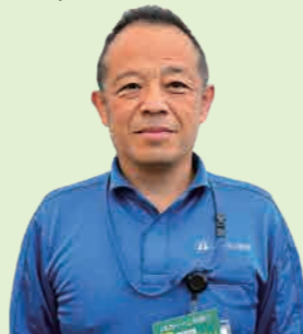
営農販売部 特販課