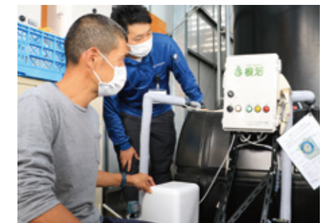
イチゴ親株の安定生産にナノバブル水製造装置を導入(令和4年度支援例)

お問い合わせ 詳しくは、最寄りの営農経済センター、または営農アドバイザーにご相談ください。