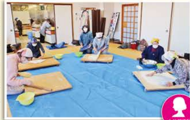
そば打ちに挑戦する女性部員ら

女性部御殿場地区本部は、JA生活センター調理室で伝承料理クラブを行い、参加者は山芋を入れたみくりやそばの作り方を学びました。 参加者は、講師の女性部員から山芋とそば粉、小麦粉の配分や生地のコね方、延ばし方などの指導を受け、一人一人そば打ちに挑戦しました。 参加者は「そば打ちは、コツを掴むのが難しい。たくさん練習して、家族や来客に手打ちそばを振る舞いたい」と笑顔を見せていました。 同女性部では、令和5年度の各クラブの申し込みを受け付けています。詳しくは最寄りの支店にお問い合わせください。