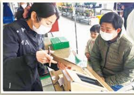
管理栄養士(左)から食生活のアドバイスを受けるベジチェック体験者

ファーマーズ御殿場は店頭で「ベジチェック」を実施し、来店者が野菜摂取量を測定しました。ベジチェックとは、手のひらを30秒ほどセンサーに当てると1日の推定野菜摂取量が分かるもので、カゴメが測定器を開発しました。 2月に実施し、「定期的に測りたい」「2月の時は摂取量が少なく、食生活を見直した。結果が表れているのを知りたい」などの声を受け、今回の実施となりました。 測定には管理栄養士が立ち会い、食生活のアドバイスなども行われ、2日間で約184人が体験しました。