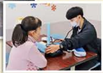
健康相談で血圧を測定する来店者(左)