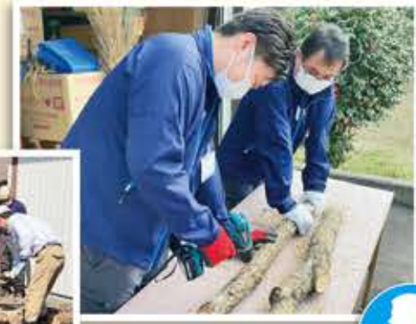
ドリルでほだ木に穴を空ける職員