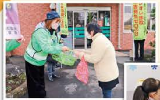
来店者(右)へ声かけし、啓発グッズを手渡す地域安全推進委員会会員

高根支店は2月15日の年金支給日に合わせ、御殿場警察署と地域安全推進委員会と共に、支店前で特殊詐欺被害防止と交通安全を来店者へ呼びかけました。 来店者の一人が「還付金がある」という電話が何度もかかっている」と話すと、警察署の関係者は「変だな、と思ったらすぐに通報していた方がいい」とアドバイスしました。 同支店では年金受給日に、地域包括支援センター「菜の花」による出張健康相談も行い、保健師に健康相談をする来店者の姿も見られました。