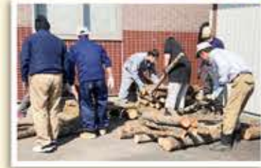
菌打ちしたほだ木は積み上げていく

足柄、小山の各青壮年部では、恒例となっているシイタケの菌打ち作業を盟友と職員で行いました。 菌打ちしたシイタケのほだ木は組合員や地域住民などに販売し、毎年人気の商品です。 3月11日は足柄支部が、ほだ木の穴空けや菌打ち、購入者への配送などを盟友、職員が分担して行いました。