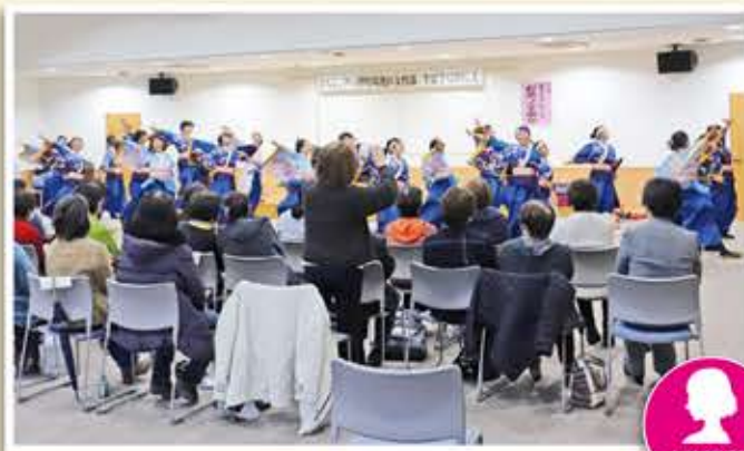
盛り上がったよさこい演舞