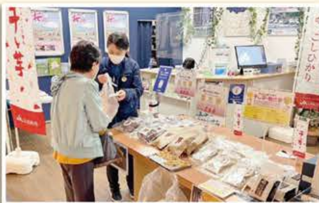
販売ブースには御殿場地区の特産品も陳列

御殿場地区販売課は、干し芋・焼き芋のPRや販路拡大のため御殿場プレミアムアウトレットで干し芋の出張販売を行いました。 10日に当JAのツイッターで広報した効果もあり、販売場所であるイーストゾーン フードバザー前の「こてんば観光案内所」には、多くの方が来店しました。干し芋の試食も好評で、「こんなに柔らかい干し芋ははじめて食べた。とても甘くておいしい」とまとめ買いする来店者の姿もありました。